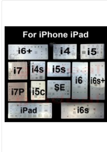
(DESCONTINUADO) Pack 13...