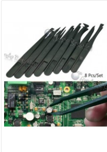
Pinzas de Fibra de Carbono...