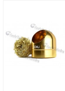
Limpiador de puntas de...